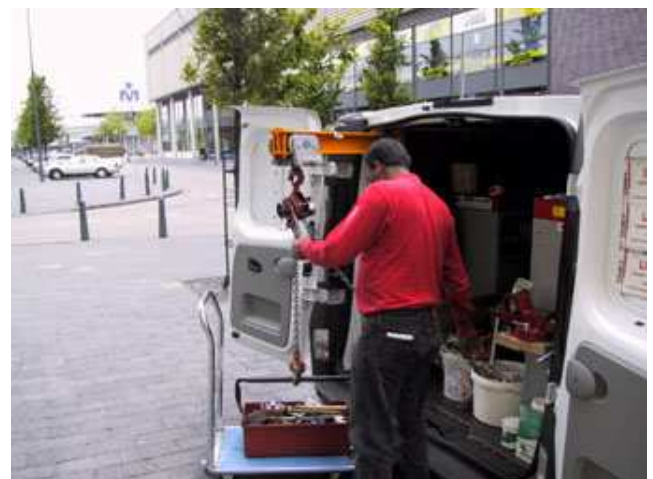
(19) Tilhulpmiddelen in de Reparatie-dienst