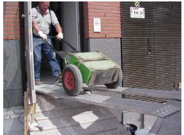
(18) Tilhulpmiddelen voor het transport van bijvoorbeeld gewichtsblokken