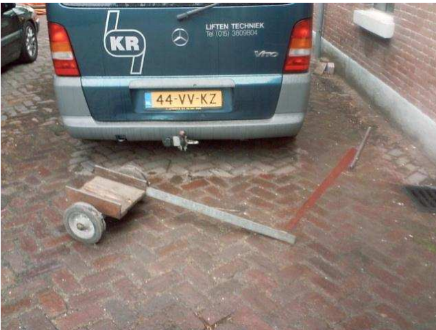
(20) Zelfontwikkeld hulpmiddelen